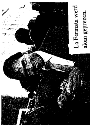
La Fermata werd alomtgeprezen.