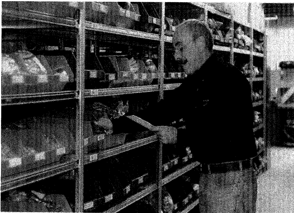
Langer doorwerken moet voor iedereen mogelijk worden gemaakt.